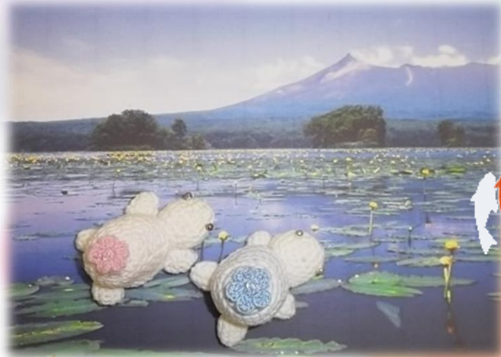
センター専属キャラクター こころちゃんとゆたかくん