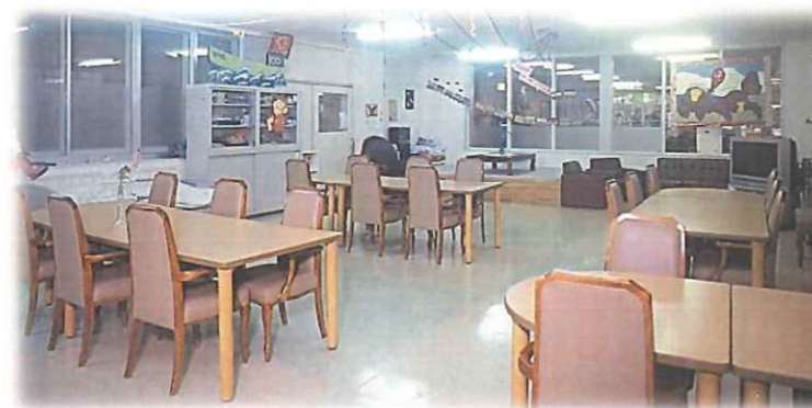
■通所リハビリテーションルーム

『すべての人々に輝くような毎日と 感動のある日々を…』 グランドサン亀田の願いです。